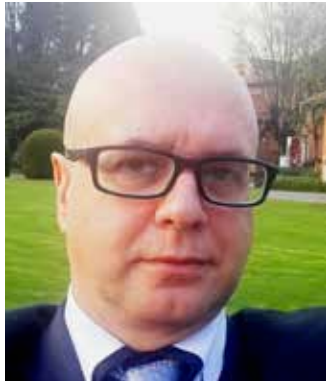
AUTOR: Germán Zarama de la Espriella Consejero Nacional SENA

Mientras los colombianos estamos pendientes del triste final de la mal llamada revolución bolivariana (ejemplo de ‘involución’ social), avanza de manera incontenible otra revolución imparables. La primera, la fracasada, acabó con millones de empleos y arruinó a todo un país, tras porfiar veinte años en un modelo económico centenerariamente fallido.