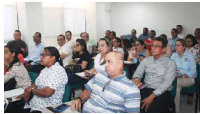
Seminario de Actualización Tributaria